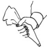
douille pour les biscuits, crèmes, etc.