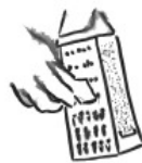
ou râpe à multigrilles pour zester les agrumes ou pour râper du chocolat