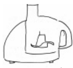
... ou un robot multifonctions équipé du gros couteau...

... ou un robot quasiprofessionnel type Kenwood, équipé du fouet (oeufs en neige ou crème fouettée) ou de l'outil K (pâtes et mélanges divers). Idéal pour les boulangers en herbe.